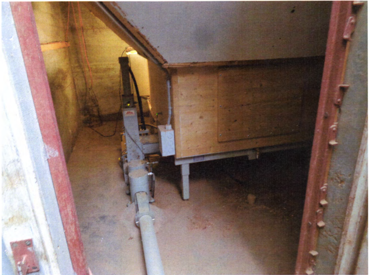
Presseinheit mit 2 Zangenzylindern und auswechselbarem Pressgehäuse